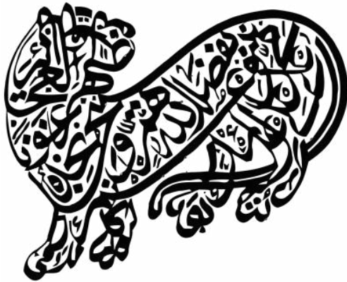
Kalligrafie van Ali als Tijger van Allah, embleem van de Ismaili en Aga Khan Dynastie 3

Zo blijft de sluimerend geest van het Manuscript van Samarkand toch steeds actief! Strevend naar de vooruitgang of eerder handelend naar de wetten van de dichterlijkheid?