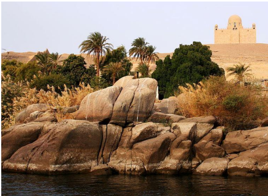
De tombe van de 3 de Aga Khan vanaf de Nijl bij het Palmeneiland bij de Aswandam