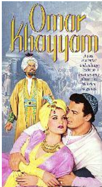
Poster voor de film 'Omar Khayyam' uit 1957.

Zo verging het ook het dichtwerk van Omar Khayyám. Het werd door een bitterzoet Hollywood op één hoop gegooid met Sheherazade. Natuurlijk laat ook Bollywood zich niet onbetuigd. Er is een hele reeks films gemaakt met Omar Khayyám als sprookjesfiguur in de hoofdrol. De eerste is uit 1924, de bekendste is die uit 1957, 'The Loves of Omar Khayyám' getiteld. Het is een Hollywood-productie van William Dieterle. Omar legt het in zijn script aan met de bruid van de sultan van Bagdad en kruist het zwaard met een door hasjiesjgebruik in een zombie veranderde, geduchte Assassijn.