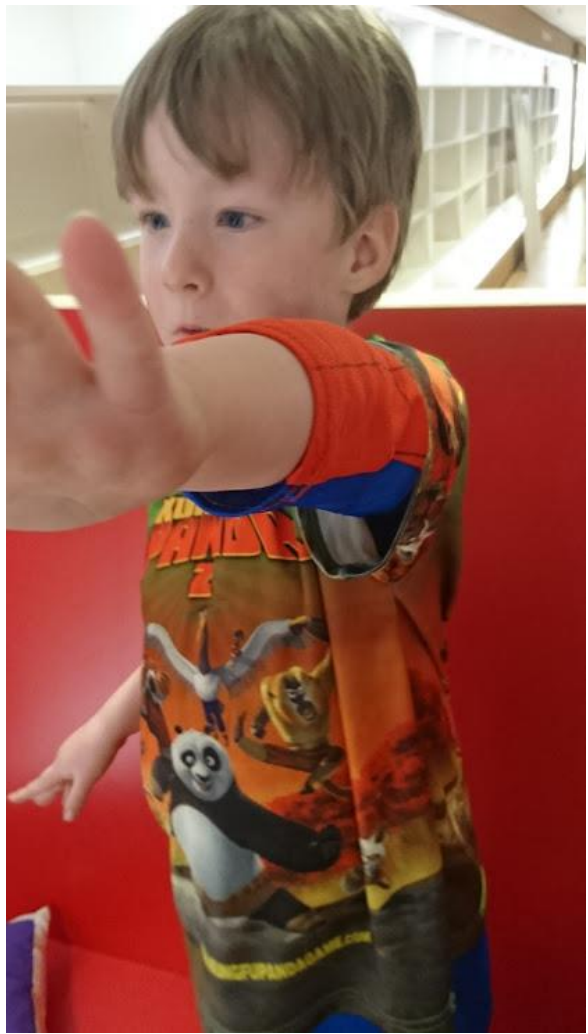
...in diverse vermommingen en situaties